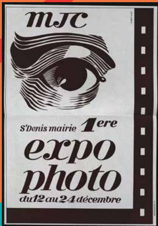
Affiche, illustr. P. Baille, imp. La Coe, 1970, Arch. mun. de Saint-Denis, 4 Fi 2494.