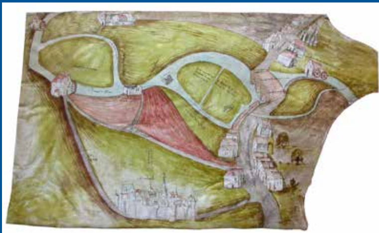
Figure de l'Essonne près de Puiseaux [1498-1519], AN, CP/S//2152.