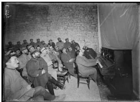
Projection de film à des soldats. Verdun, 1916.

La conférence sera suivie de la projection du film Les fêtes de la victoire du 14 juillet 1919 . (20 minutes)