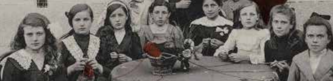
Groupe d'élèves de l'école de Crocy (Calvados) en août 1914, 71AJ/71.