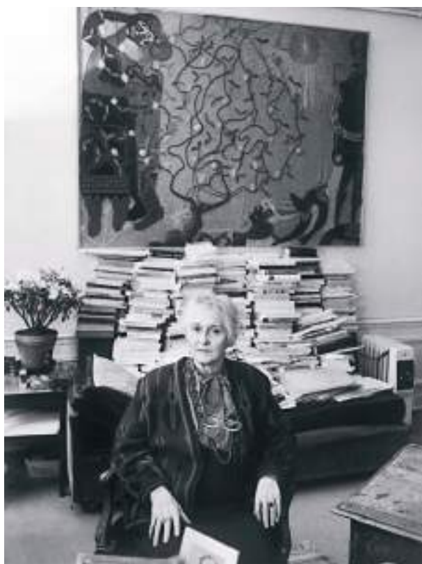
Françoise Dolto, 1987.

Association française des femmes diplômées de l'université, Association nationale des travailleuses sociales, Association nationale d'entraide féminine (France), Parti féministe unifié, Fédération française des éclaireuses, Société des filles de la Révolution américaine, chapitre Rochambeau.