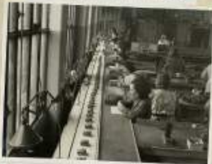
Elle travaille avec précision sur une opération.