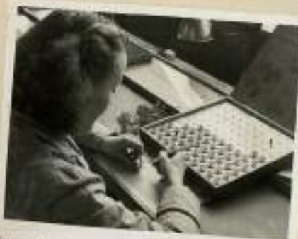
L'exactitude de son travail de réglage est essentielle pour la qualité.