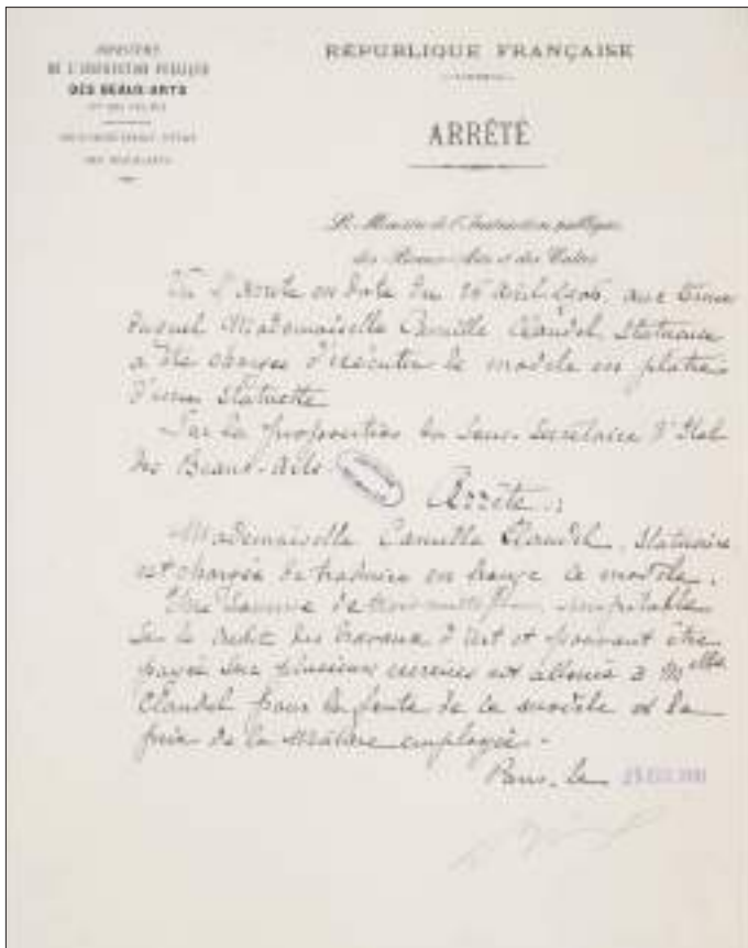
Camille Claudel.