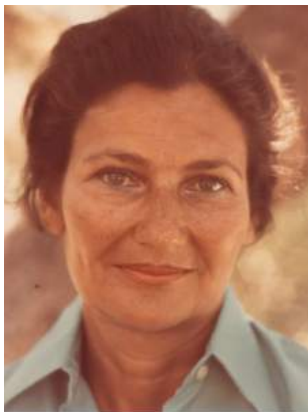
Simone Veil. 688AP/456/NC. © Tous droits réservés.