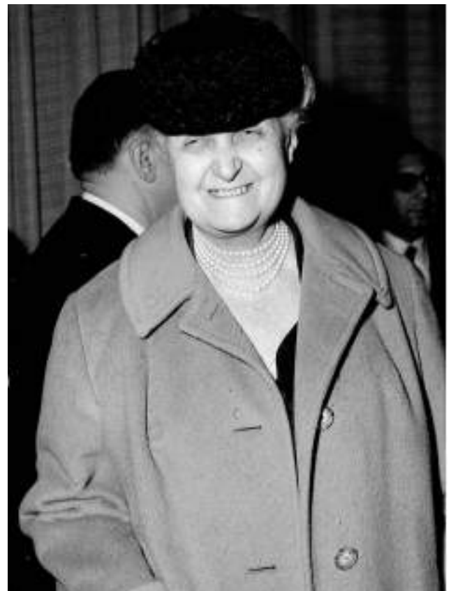
Geneviève Tabouis. 27AR/267, photo n°46.