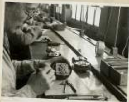
Elle travaille avec précision sur une opération.