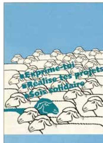
Fonds ANACEJ. © Arch. nat

Archives nationales, site de Pierrefitte-sur-Seine, salles des commissions 3 et 4