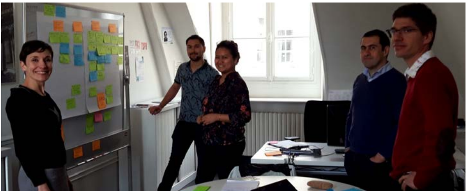
Atelier du 29 avril pour écouter les besoins exprimés par les journalistes

Nous avons sollicité pour cette étude trois profils d'utilisateurs : des journalistes, des étudiants et des enseignants-chercheurs. L'idée est de comprendre leur expérience de recherche documentaire sur Internet, afin de leur proposer un outil intuitif et fluide pour faciliter leur accès aux archives numériques. Progressivement, nous élargirons l'offre à d'autres publics.